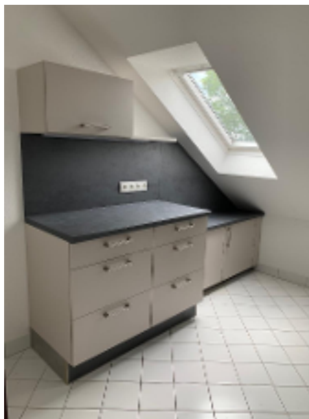
Küche mit neuer Einbauküche