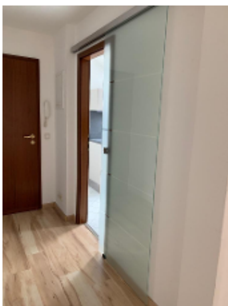
Zugang zur Küche