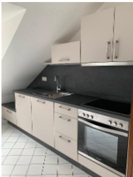
Küche mit neuer Einbauküche