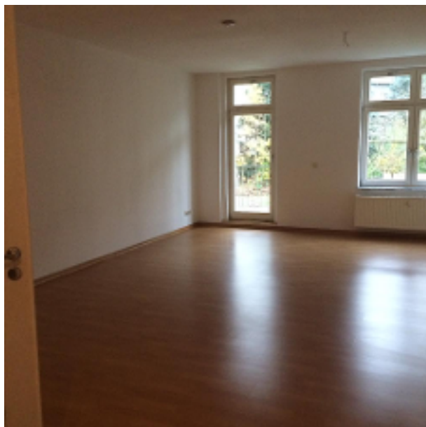
Wohn-/Schlafzimmer mit Zugang zum Balkon