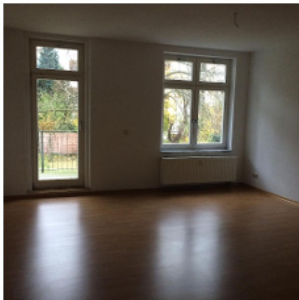
Wohn- /Schlafzimmer mit Zugang zum Balkon