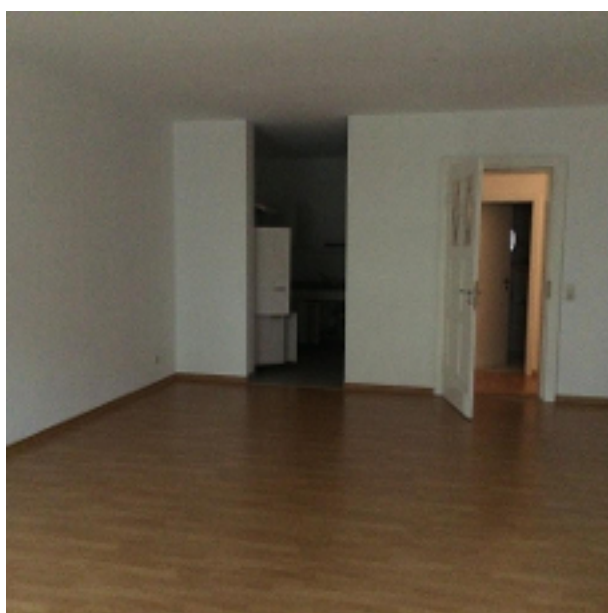
Wohn-/Schlafzimmer mit Zugang zur offenen Küche