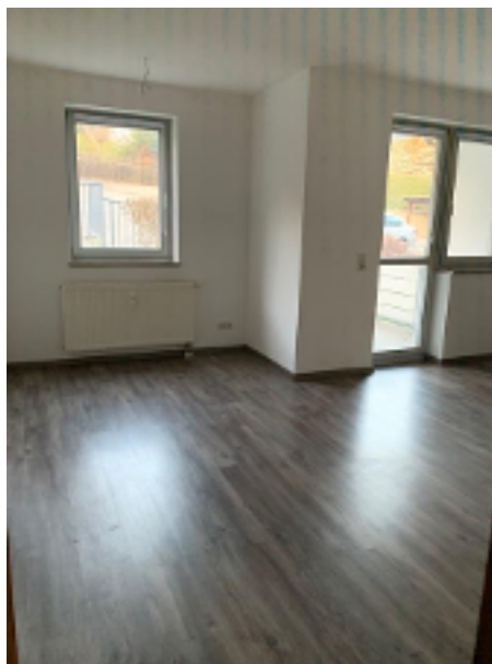
Wohnzimmer mit Zugang zum Balkon