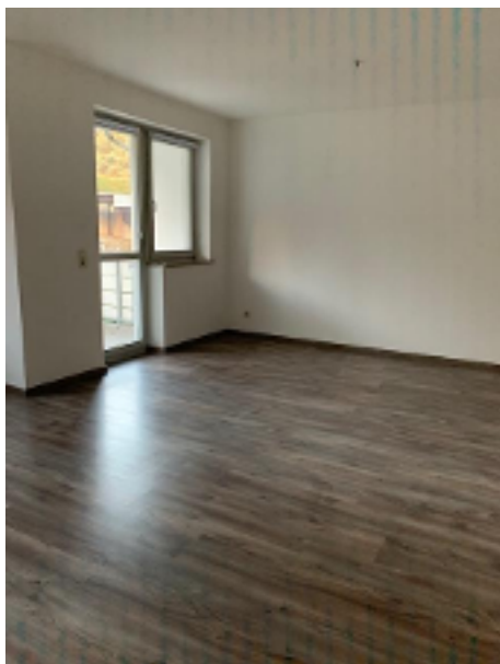
Wohnzimmer mit Zugang zum Balkon