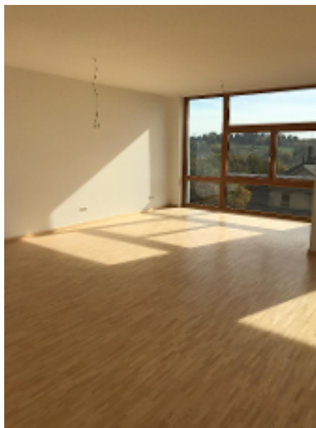
offene Küche + Wohnbereich