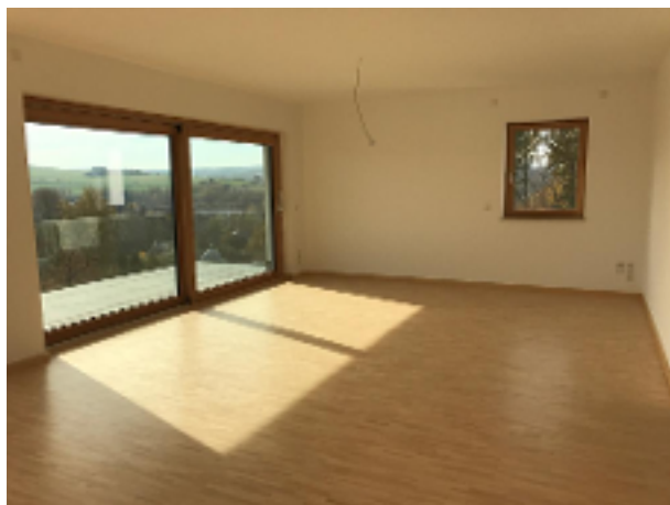
offene Küche + Wohnbereich